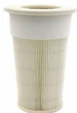
Filtro in poliestere*