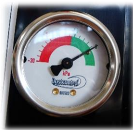
Manometro che indica quando pulire i filtri