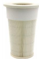
Filtro in poliestere