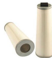
Filtro Hepa H13