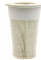
Filtro in cellulosa (mod. C e L) Filtro in poliestere (mod. A)