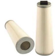
Filtro Hepa H13