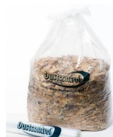
Sacchi di raccolta polveri