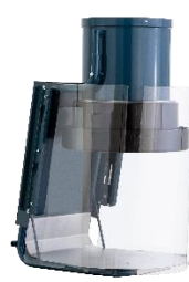
Protezione in plastica per sistemi C ed L