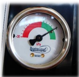
Manometro che indica quando pulire i filtri