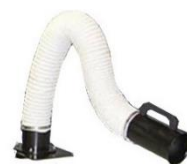
Versione a banco «S»