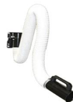
Versione a parete